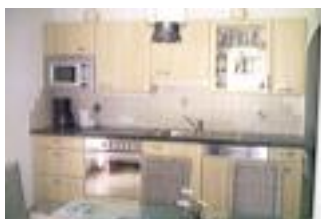
Preis pro Appartement/Nacht